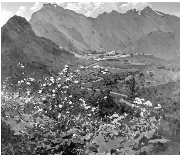
Рис. 3. У.Тансыкбаев. «Моя песня»