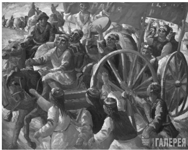
Рис. 1. А. Волков. «Красный обоз»

Обратимся к работам А. Волкова, А. Николаева (Усто-Мумин) и У. Тансыкбаева. Но прежде чем говорить конкретно о творчестве этих художников, отметим, что передовыми являлись художники-графики, особенно плакатысты.